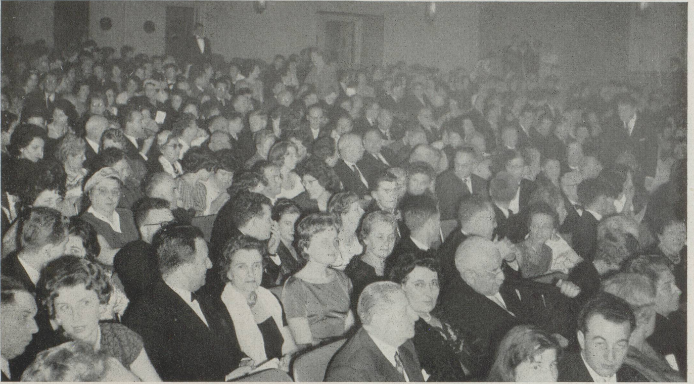
Salle comble ! Les Suisses et leurs amis sont accourus nombreux à la fête de Bienfaisance