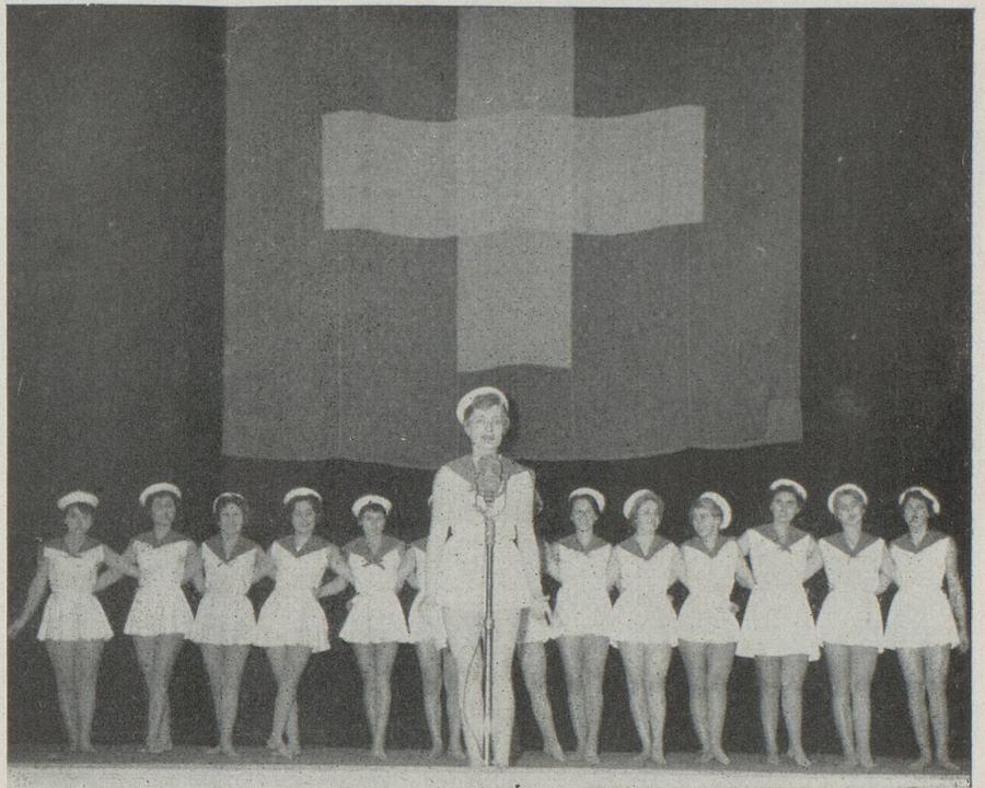
La sympathique speakerine a annoncé chaque numéro avec beaucoup d'esprit. La voici présentant les gracieuses gymnastes exécutant la danse des « mousses de la marine suisse »

Gros succès des gymnasiarques dans leurs mouvements rythmés par