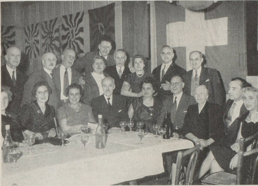
Un tableau d'honneur où chacun se reconnaîtra...