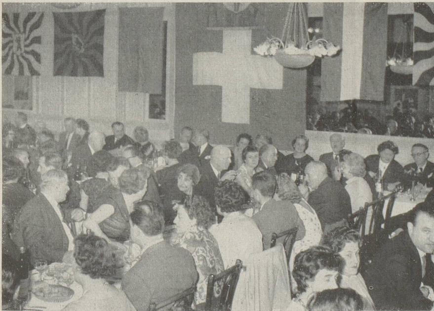
Le banquet fut des plus animés.