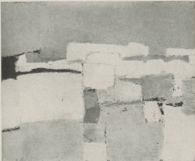
TUNISIE, par Charles MEYSTRE

Mais il est bien évident qu'une telle démarche créatrice n'est possible que par une « mise en état de l'être ». Il ne s'agit pas tant de recettes picturales à analyser (encore que la question plastique garde toute son importance) que de bien voir que le résultat acquis ne peut l'être que par une suite de renoncements, de sacrifices et d'humbles recherches poursuivies des années durant. Il y faut des qualités d'endurance, qui relèvent alors ici du domaine moral, et, pour qui connaît l'expérience, le saut que représente pour un artiste suisse la transplantation à Paris, la peinture de Meystre acquiert une dimension qualitative de plus.