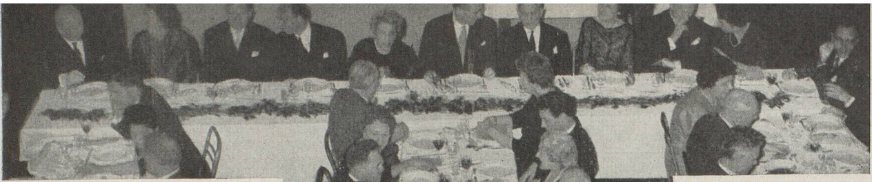
Table du milieu