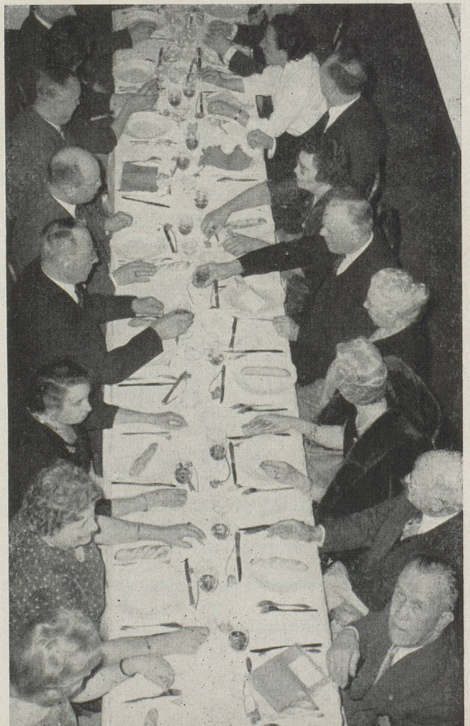
Table de droite

C E R C L E C O M M E R C I A L S U I S S E