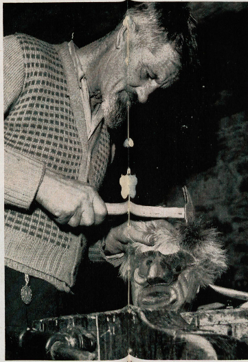
Le sculpteur va lui-même aux abattoirs choisir les dents de vaches qui compléteront l'expression démoniaque de ses masques. Quant aux cheveux, ils sont faits de poils de chèvre ou de mouton.

Il est maintenant fort difficile de découvrir des masques anciens, la plupart d'entre eux ayant été acquis par des collectionneurs et des musées. A ce propos, il convient de signaler la belle collection de masques du Musée d'ethnographie de Genève, l'une des plus complètes et des plus variées que l'on puisse voir.