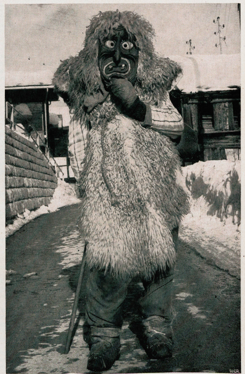
Le vrai costume de Carnaval est formé de peaux de mouton. Les jambes et les pieds sont enveloppés dans des sacs de jute. Le travesti porte une cloche de vache accrochée dans le dos et il parcourt les rues du village en sautillant. Quant aux masques, ils sont sculptés de manière telle que la lumière des flambeaux rende leur expression mobile... et encore plus effrayante.