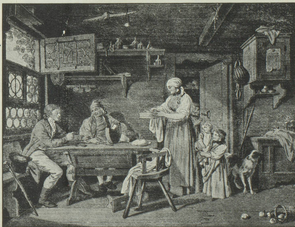
Sigmund Freudenberger, Bern, 1745—1801