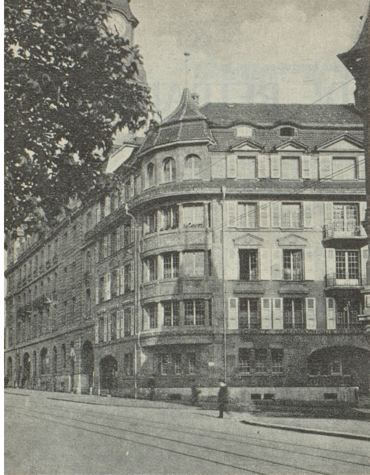
L'A.T.S., il y a quarante ans