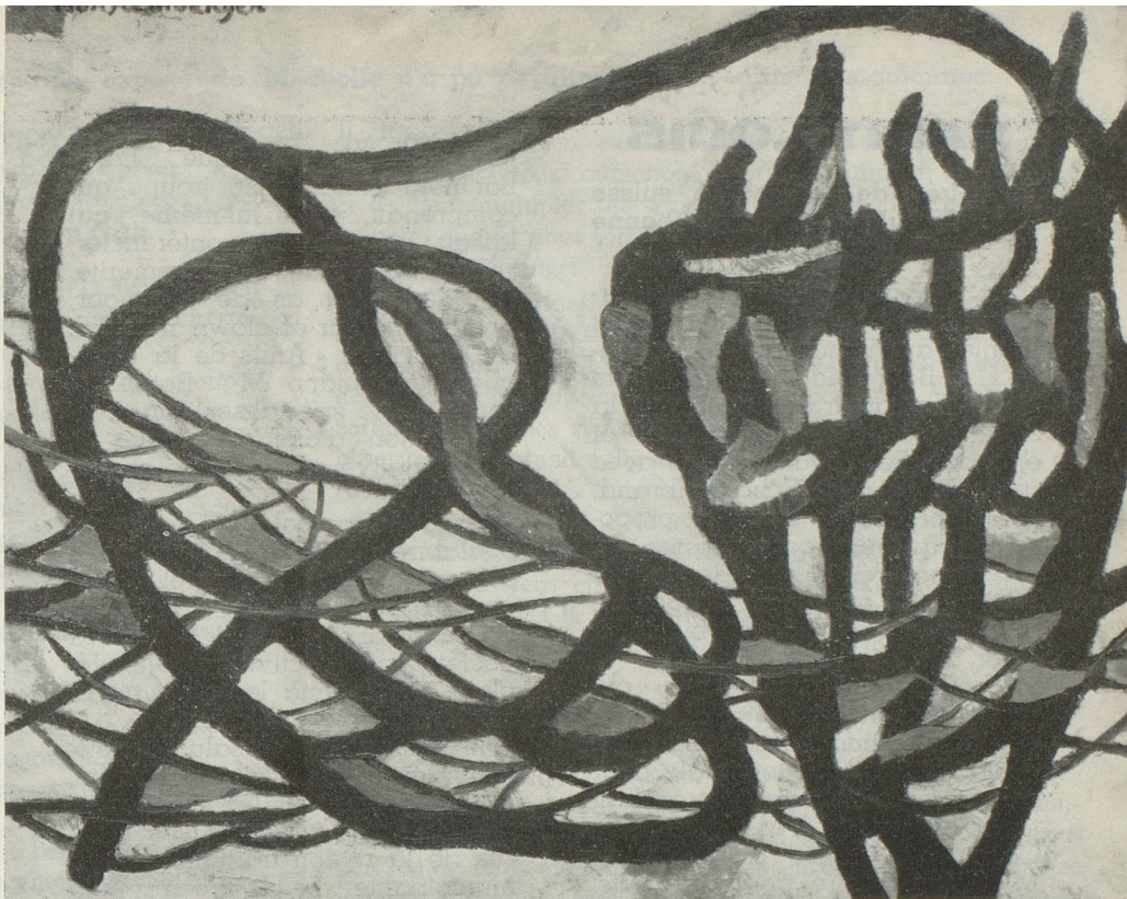
André de Wurstemberger : « Epaves »