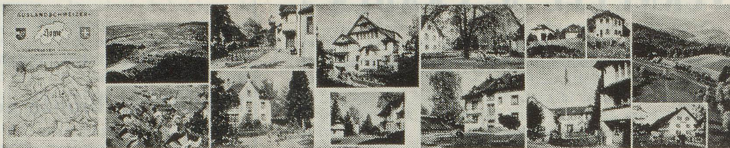
« Le petit village » dans le village