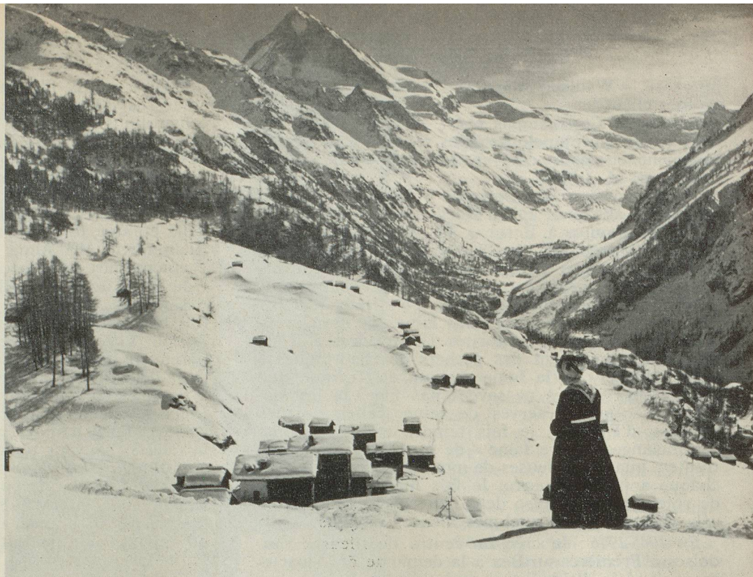
Vue du Val-d'Hérens, sous la neige. C'est à l'intérieur de ces chalets et mazots que l'on file encore la laine.

Si la Haute Couture de Pa- ris, si les tisserandes d'Art veulent bien employer mes belles laines, chacun aura la satisfaction d'avoir acquis une qualité de laine exclusivement faite à sa mesure. C'est mon vœu le plus cher pour 1968.