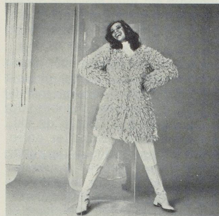
Manteau des neiges entièrement tricoté en Leyvolaine beige chiné, création Eliane Schenk, photo R. Lutz.