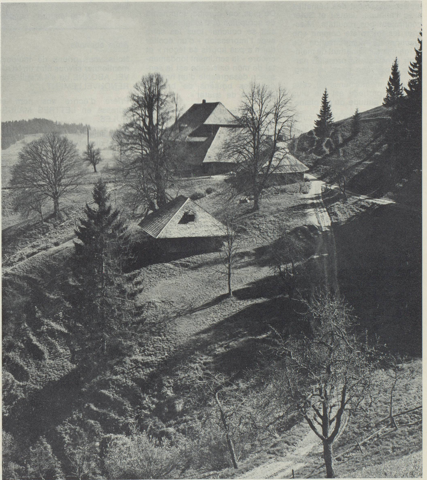
Avant-printemps à Ludernalp, près de Langnau dans l'Emmental