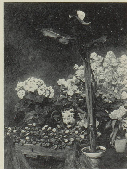
« Fleurs » d'Auguste Renoir. 1864.