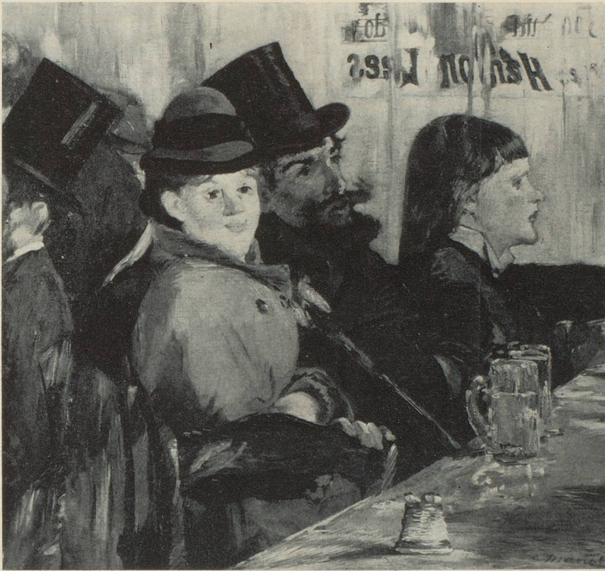
« Au café », d'Edouard Manet. 1878.

cent fois plus fort que tout le monde... »