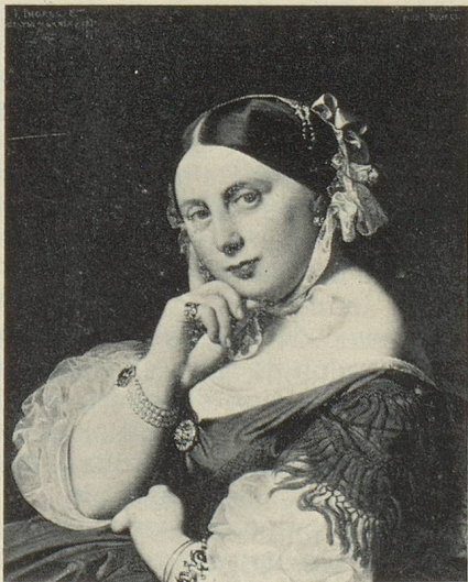
Portrait de Madame Ingres, née Delphine Ramel, par Jean-Auguste Dominique Ingres. 1859.