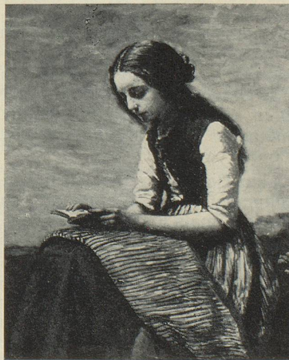
« La petite liseuse », de Camille Corot.