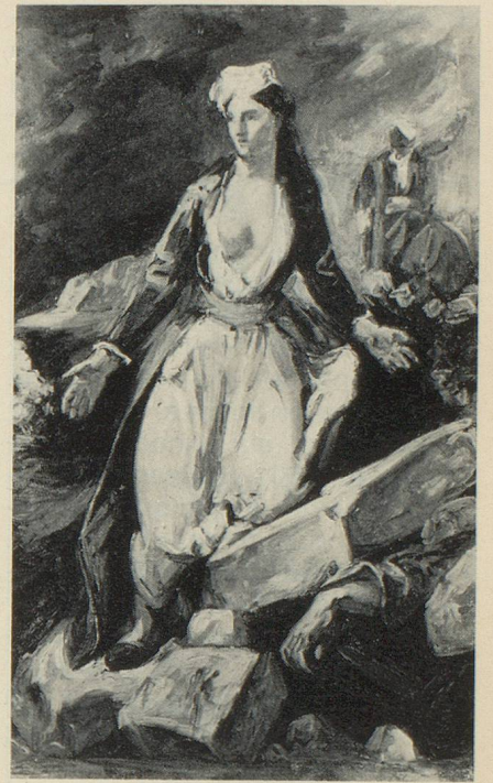
« La Grèce expirant sur les ruines de Missolonghi », d'Eugène Delacroix.