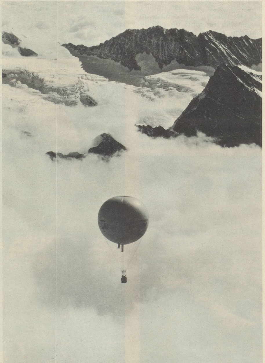
Ballon voguant au-dessus de la mer de brouillard