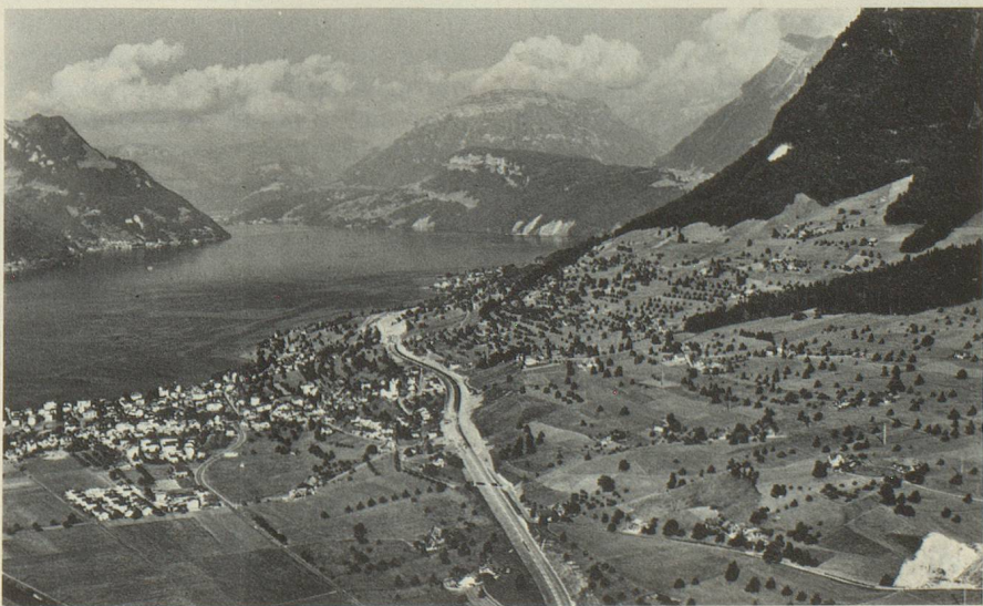
La Nationale 2 actuellement en construction au bord du lac des Quatre-Cantons.