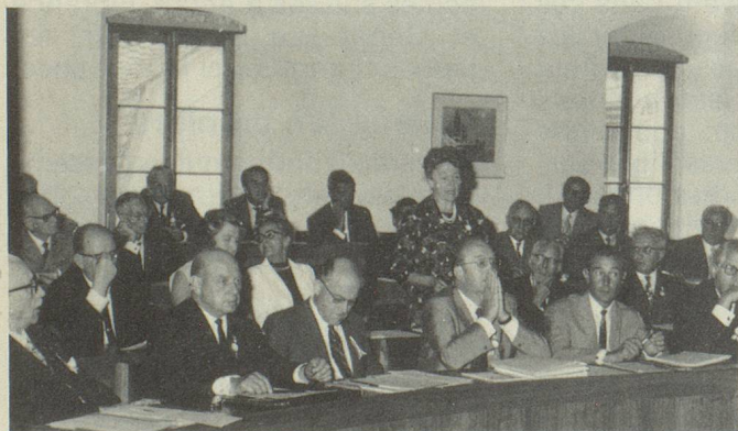
La séance de la Commission des Suisses de l'étranger.