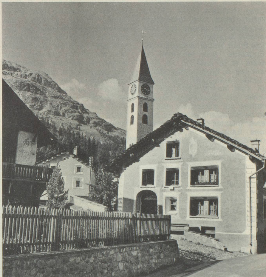
l'Eglise de Silvaplana

J'exagère? Je peins le diable sur la muraille? Prenons alors l'exemple de l'Engadine. Il est peu de Suisses qui n'ont pas fait une fois le pèlerinage de la région des lacs (de Silvaplana à Maloja), région d'une beauté infinie où il semble que les