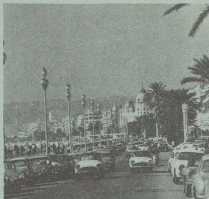
4, avenue Georges-Clemenceau. Tél. : 88-85-09 - 88-54-76.