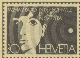
50 e anniversaire de la radio en Suisse, 1922-1972.