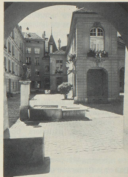
Berne à la française.

L'ancien régime des familles patriciennes a conféré à la ville de Berne un cachet élégant, qu'elle a su conserver en plein 20 e siècle. Les relations étroites de ces familles avec la France, où leurs fils servaient régulièrement comme officiers dans la garde du roi, ont laissé un goût très prononcé pour la culture française. Quoique la ville se trouve bien sur territoire de langue suisse-alémanique, le français y est parlé couramment, ce qui donne parfois lieu à un curieux mélange, tout comme en Alsace. On entend fréquemment des tournures telles que «guete bonjour», et «merci» et «s'il vous plaît» remplacent les «danke» et les «bitte». Il y a quelques lustres on pouvait encore voir le nom des rues en deux langues: la «rue des chaudronniers» par exemple côtoyait la «Kesslergasse». La descendance