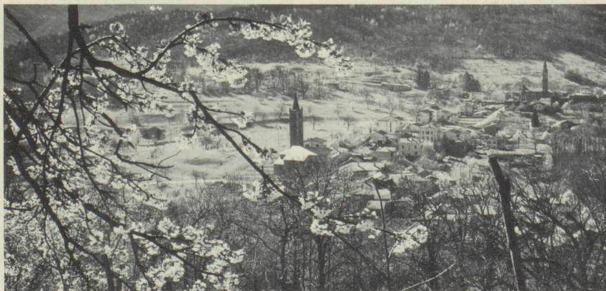
Printemps sur les villages de Sala et Vaglio.

Le but de ces remarques était de dégager certaines constantes et les limites d'une situation culturelle; elles ont, par conséquent, quelques lacunes sur le plan de l'information, des lacunes d'ailleurs inévitables lorsqu'on essaie de rendre compte d'une matière vivante qui est encore en formation.