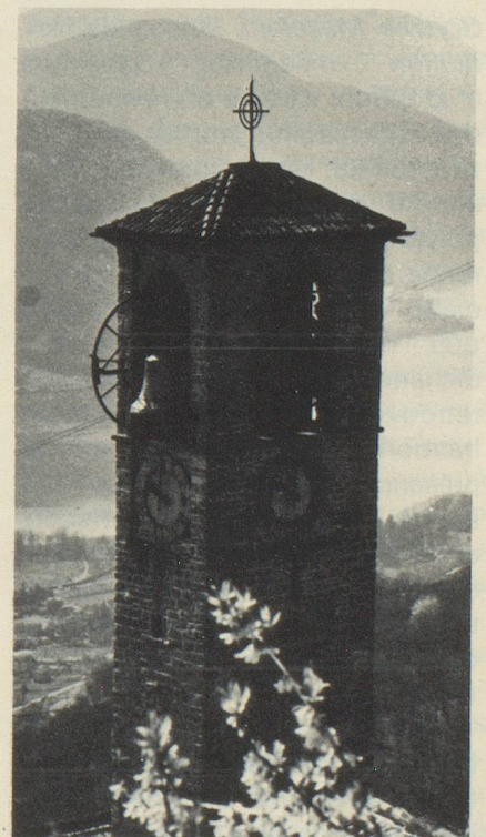
Clocher de Cademario

La conscience que l'homme est un témoin de son temps est d'ailleurs l'un des traits caractéristiques de la poésie de ces dernières années. Ainsi, chez Giorgio Orelli , puisqu'il est nécessaire de revenir à lui, qui a pris conscience de cet aspect critique et sociologique de la littérature; sa poésie prend maintenant une allure discursive où se mêlent les réflexions et les images nées d'une réalité menacée sur le plan social et sur le plan de la relation entre l'homme et la nature, cette dernière étant comprise comme une condition existentielle et politique. Une certaine conscience civile pousse désormais les poètes à analyser les forces en