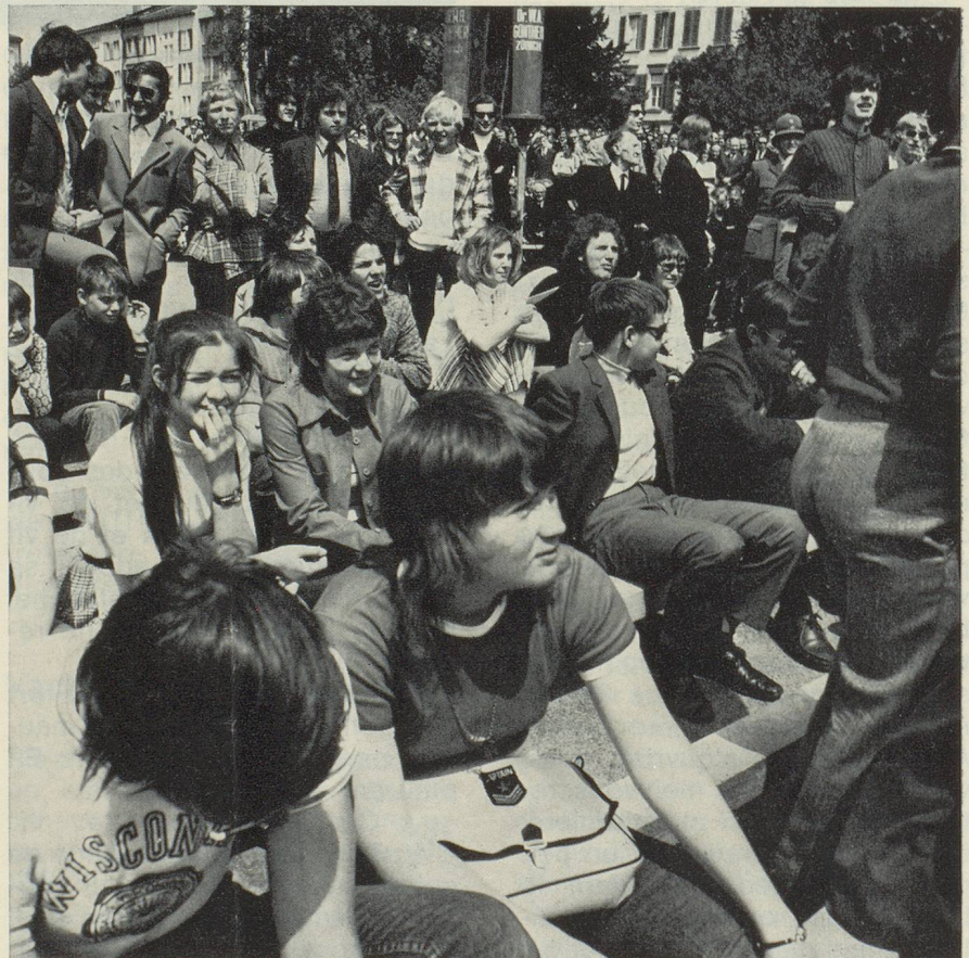
Les électrices entrent dans l'arène politique. A Glaris les places entourant l'estrade du gouvernement sont réservées aux écoliers qui font ainsi très tôt l'apprentissage de la vie politique.

Les « Landsgemeinde » ont lieu chaque année au printemps. Le dernier dimanche d'avril à Sarnen (Obwald), Stans (Nidwald), Appenzell (Rhodes-Intérieures), Trogen, les années paires et Hundwil, les années impaires (Rhodes-Extérieures) et le premier dimanche de mai à Glaris.