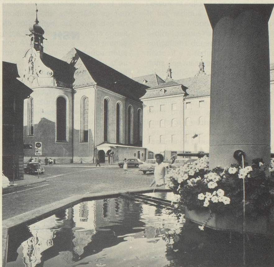
St-Gall, place Gallus

Le Secrétariat des Suisses de l'étranger, Alpenstrasse 26, CH-3006 Berne se tient à votre disposition pour tous les renseignements