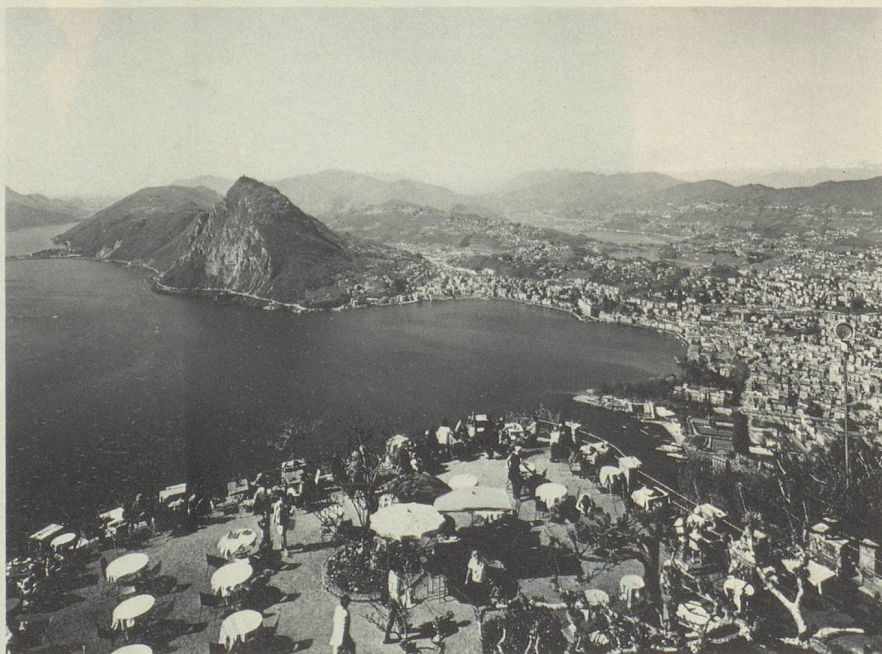
Vue sur Lugano et le Mont San Salvatore depuis le Monte Brè

— Et si vous acceptez mes conditions, je suis disposé à commencer le 1 er mars 1998...!