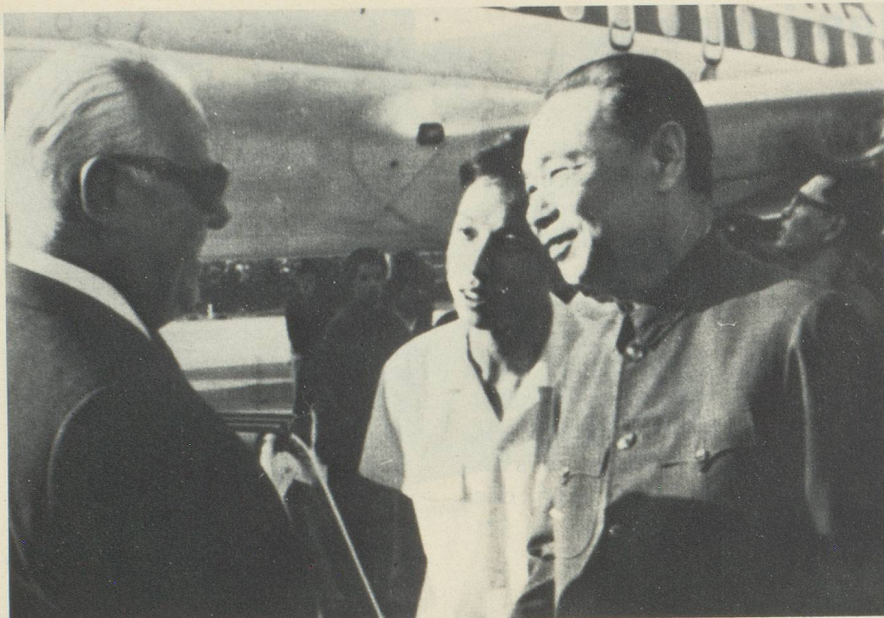
Le Conseiller fédéral Graber accueilli à Pékin par son homologue chinois Tschi Peng Fei.