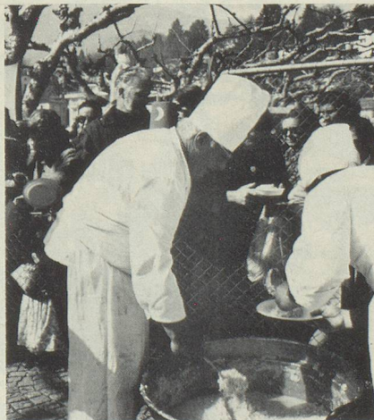
Même s'il est préparé pour des centaines d'estomacs affamés, le risotto reste une vraie spécialité gastronomique.

Dimanche 16 février 1975, Francini réunit tous ses fidèles amis et leur famille au Grand Hôtel du Pavillon, 36, rue de l'Echiquier à Paris X, pour un banquet suivi de bal. Inscriptions auprès de : Prospère César, 104, rue d'Avron - Tél. DID 05-43.