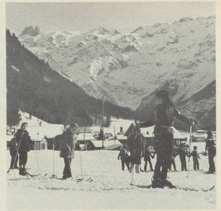
Dans chaque station, les écoles suisses de ski comportent des classes pour enfants. Les écoliers de 4 à 12 ans y apprennent les rudiments de l'art du ski.