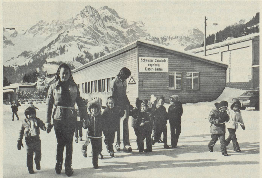
L'après-midi, les monitrices reconduisent les juniors à l'école de ski.

Office du tourisme. 4-8 ans ; jours ouvrables matinée et après-midi.