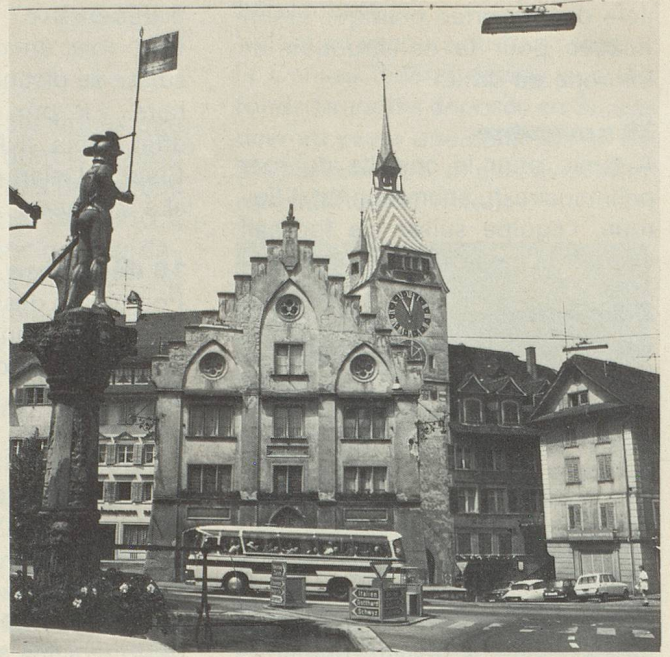
Zoug: Place Kolin et sa fontaine «Linden».