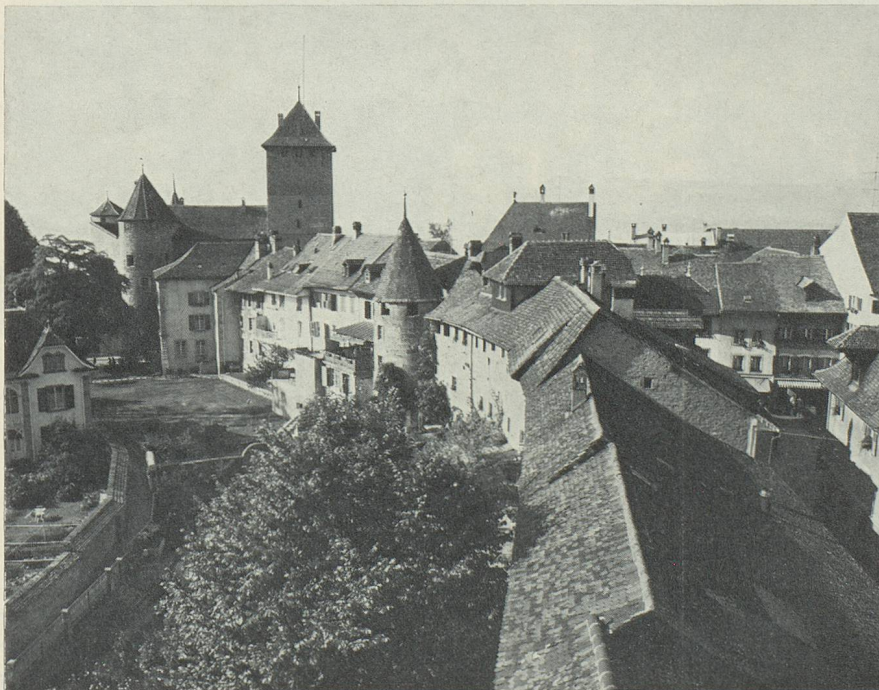
Morat (Pays de Fribourg), petite cité médiévale avec son enceinte très bien conservée.

communauté paysanne vivante, attrayante pour les gens qui y travaillent.