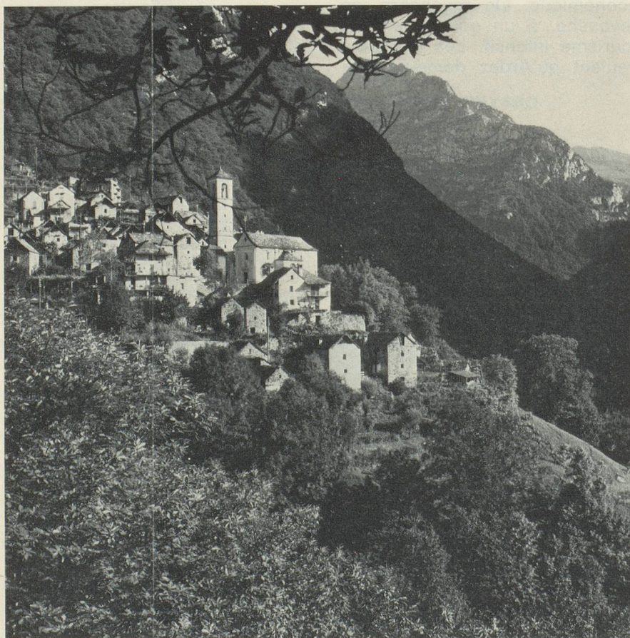
L'une des quatre réalisations exemplaires de Suisse pour l'Année européenne du patrimoine architectural 1975 : Corippo (Tessin) petit village aux maisons serrées dans le Val Verzasca.

de moutons. Les habitants gagnent leur pain à Locarno et dans les environs. Corippo forme encore un tout homogène. Le problème essentiel consiste à rendre à nouveau habitables les vieilles maisons délabrées. La sauvegarde de la localité exclut la construction de nouvelles maisons. Il convient au contraire de tout faire pour conserver à la population l'espace habitable traditionnel, équipé du confort indispensable. Parallèlement, il importe d'adapter l'infrastructure, d'améliorer les services, de créer une nouvelle base économique. Ce village tessinois ne doit pas devenir un « musée vivant ». Des projets de solution ont été élaborés depuis longtemps. Il faut espérer maintenant que, par l'effort particulier entrepris dans le cadre de l'année européenne, Corippo puisse devenir le modèle d'une réalisation pratique.