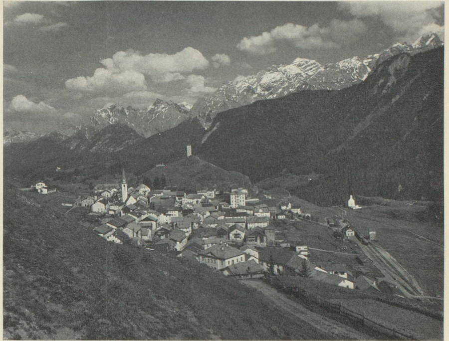
Ardez (Basse-Engadine). Le village s'intègre harmonieusement dans le paysage.

Ardez n'a plus connu de ces gigantesques incendies qui ont ravagé tant d'autres localités de la vallée ; la commune qui s'étale au pied du Steinsberg, marqué par son donjon surplombant la contrée, se présente comme l'ont connue les siècles. Tout au long de la rue principale se pressent les maisons de style engadinois, avec leurs larges portails, leur forte maçonnerie, leurs fenêtres étroites. Les façades de ces maisons sont fréquemment peintes ou ornées de sgraffites. La menace qui pèse en première ligne sur cet ensemble villageois unique, c'est l'abandon, car une restauration revient très cher. Il importe aujourd'hui, en premier lieu, de construire une route de contournement, ce que l'on s'apprête à faire. Des maisons vides ou mal utilisées, idéales pour le paisible tourisme familial, offrent une possibilité de développement économique. On renoncera, en revanche, à un équipement de tourisme intensif. Les habitants veulent qu'Ardez demeure une