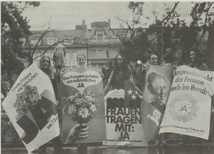
Charmantes ambassadrices des droits politiques féminins.

Nous sommes tous nés en tant qu'individus dans un environnement déterminé et un temps donné. D'après nos conceptions morales et juridiques suisses, chaque vie humaine a autant de valeur et aussi chacun a le droit de pouvoir se développer, de s'épa-