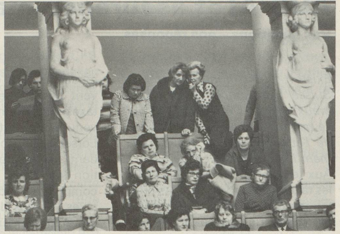
Des auditrices au Conseil national.

Ainsi, seulement 31,6% des jeunes passant une maturité sont des filles et 25% seulement d'entre elles commencent des études universitaires. En 1973, 181 femmes ont obtenu le titre de docteur (sur un total de 1279 doctorats accordés). Très peu de femmes ont terminé leurs études aux deux écoles polytechniques fédérales ainsi qu'à l'École des hautes études économiques et sociales. Il en résulte que l'on trouve très peu de femmes aux postes importants de notre économie et de notre industrie.