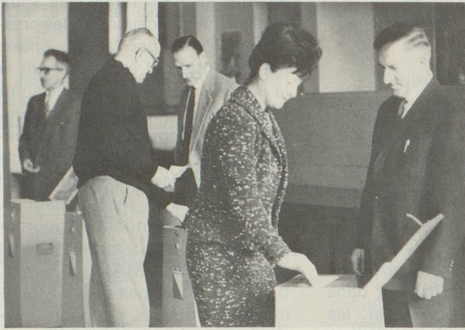
Au local de vote.