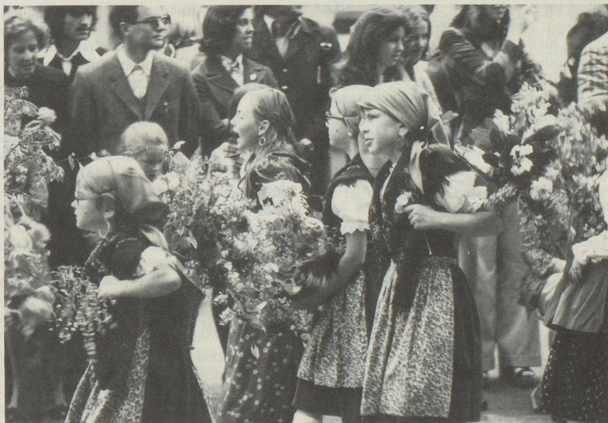
SECHSELAUTEN. — Fête traditionnelle du printemps à Zurich. Le dimanche, cortège des enfants.