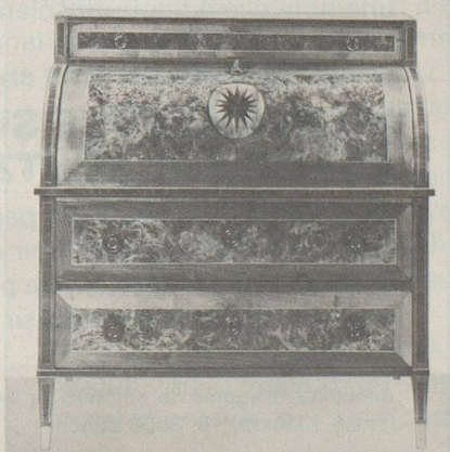
Secrétaire Louis XVI, Berne

Neuchâtel et Genève, qui eurent sans conteste, entre 1700 et 1830, les plus élégantes demeures, n'étaient pas en avance dans le domaine de la fabrication de meubles par le fait que les riches familles de ces deux cités faisaient venir leur mobilier presque exclusivement de Paris et de Lyon. Au Tessin aussi, les quelques familles aisées d'autrefois semblent avoir eu une prédilection pour le