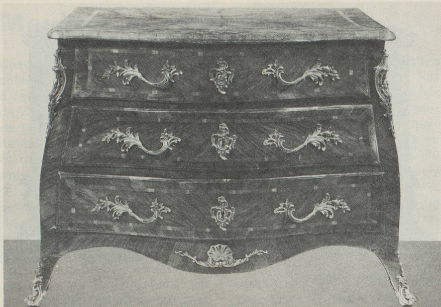
Commode Louis XV, Berne