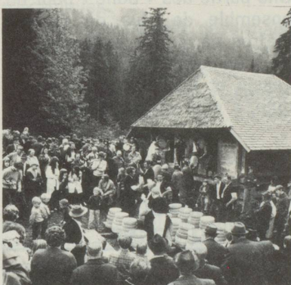
Le jour de la descente de l'Alpe, c'est une joyeuse réunion des paysans, de leur famille, où les touristes sont aussi bienvenus. On prépare la distribution des pièces.