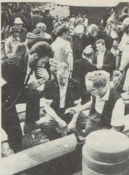
Beaucoup de pièces sont immédiatement revendues et il s'ensuit une joyeuse ambiance de marchandage.