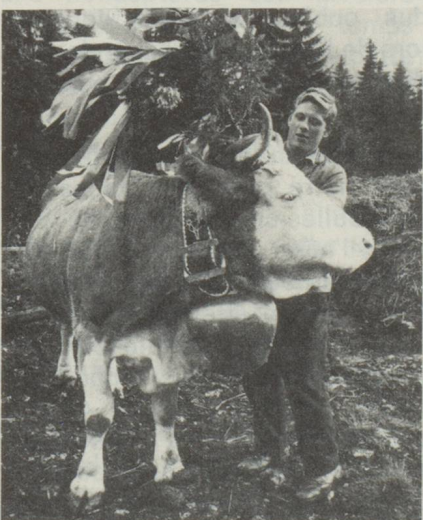
On se prépare pour la descente de l'Alpe. La vache conductrice est enrubannée et décorée.

De plus, la pression de la concurrence mondiale n'a pas diminué.