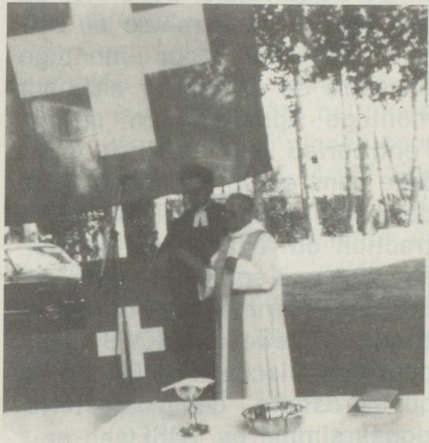
Célébration du culte oecuménique