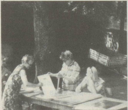
Le stand des Arts