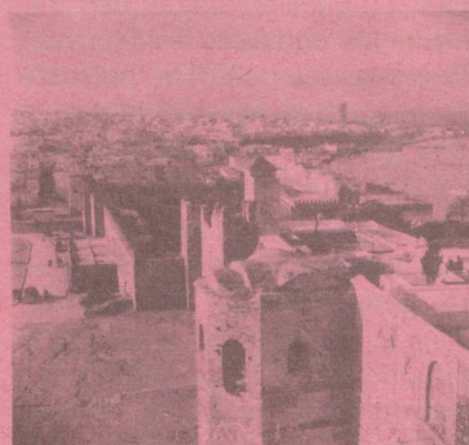
Rabat Ambassade de Suisse Boîte Postale 169 Square Condo-de-Satriano.