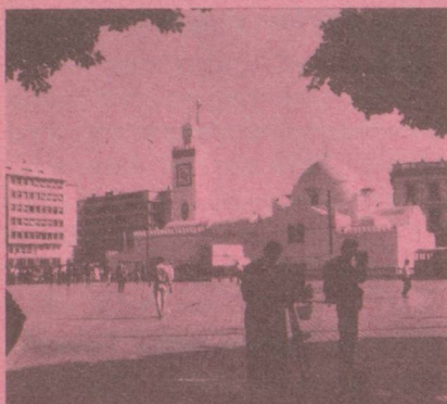
Ambassade, 27 Bld Zirout Youcef, de 9 h à 12 h du dimanche au jeudi, Boîte postale 482, Alger-Gare, Algérie.