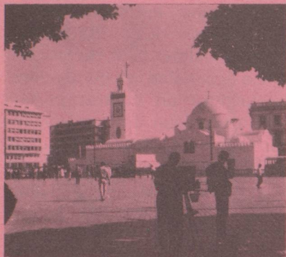
Ambassade , 27 Bld Zirout Youcef, de 9 h à 12 h du dimanche au jeudi, Boîte postale 482, Alger-Gare, Algérie.