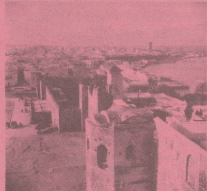
Rabat Ambassade de Suisse Boîte Postale 169 Square Condo-de-Satriano.