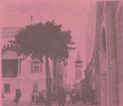
Ambassade de Suisse 17, avenue de France