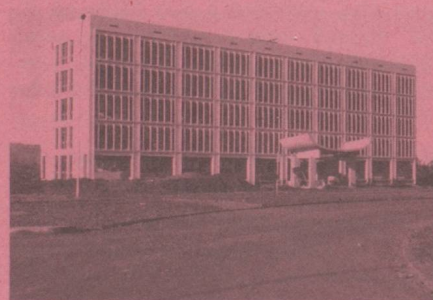
Ambassade de Suisse B.P. 597 KIGALI 21, boulevard de la Révolution Bâtiment de l'Agence Maritime Internationale (AMIRWANDA), 1 er étage, tél. : 5534