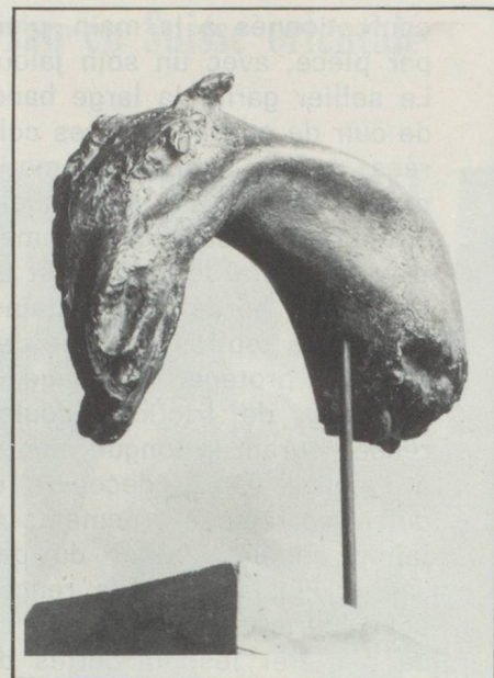
« Tête de Cheval »

Ecole du Cercle commercial suisse 10, rue des Messageries, 75010 PARIS Téléphone : 770-20-66