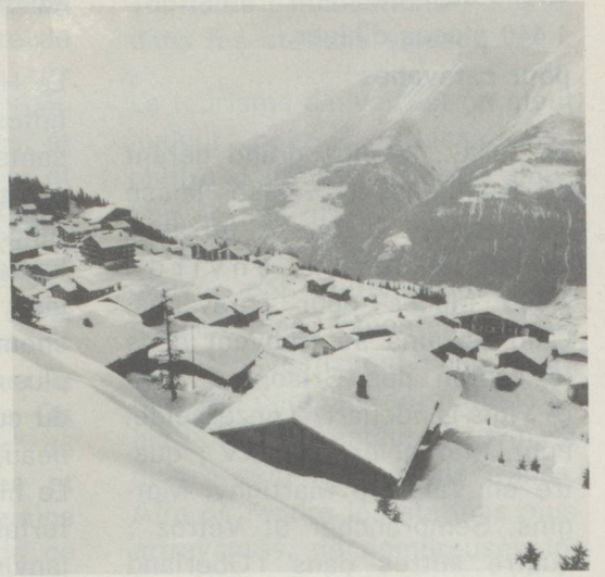
▲ A Bettmeralp au-dessus de la vallée du Rhône, venez découvrir l'agrément et la joie de vacances libérées du bruit et de l'agitation de la vie citadine/Valais.