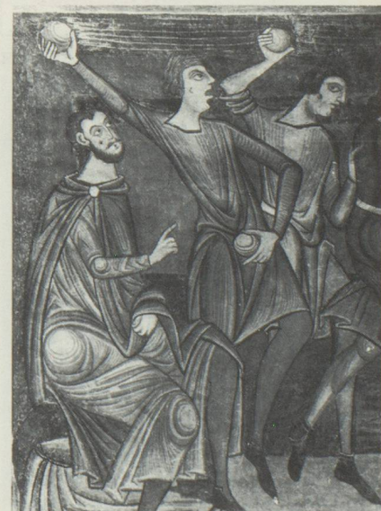
Peintures romanes dans l'abbatiale de Münstair.

Dans le domaine de l'assistance publique, la règle est que la Confédération ne vient en aide à un concitoyen double-national domicilié à l'étranger et tombé dans le besoin que lorsque c'est la nationalité suisse de l'intéressé qui prime. Mais c'est en premier lieu