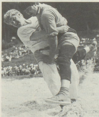
Un sport national, la lutte