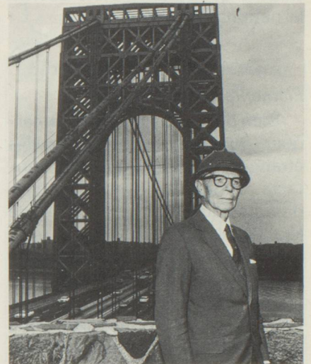
O. H. Ammann devant le «George Washington bridge»

Il représente l'émigré suisse typique. Il ajoute à l'esprit helvétique, fait de modestie et de soin, de sérieux et de simplicité, le besoin de croquer les espaces et les difficultés. Où le gigantisme et le défi technique fleurissent, le mélange est efficace. «Pour un demi-siècle d'inspiration exceptionnelle dans la conception esthétique et matérielle des ponts», Ammann reçut en