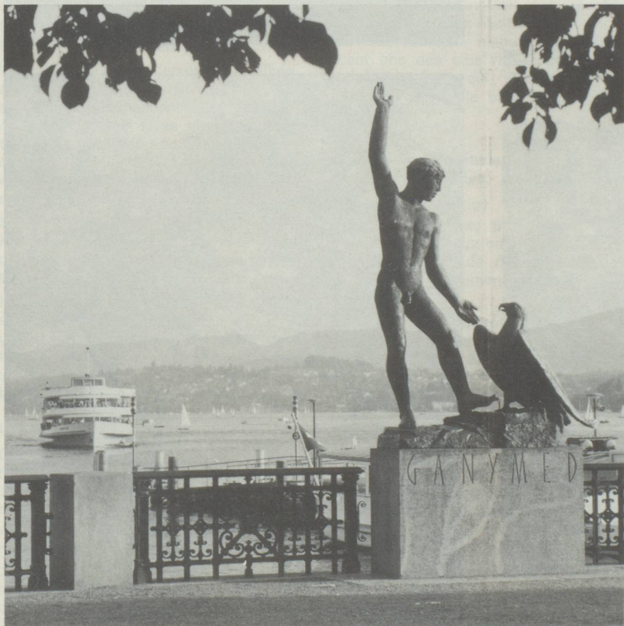
Burkliplatz : A vue effleuré le lac de Zurich jusqu'au Préalpes. Au premier plan, Ganymède, plastique du sculpteur Hermann Hubacher.