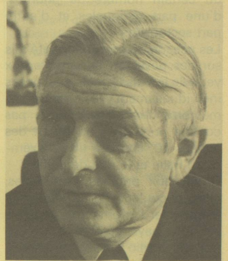
Ernst Brugger, ancien conseiller fédéral, président de la Commission dès 1979