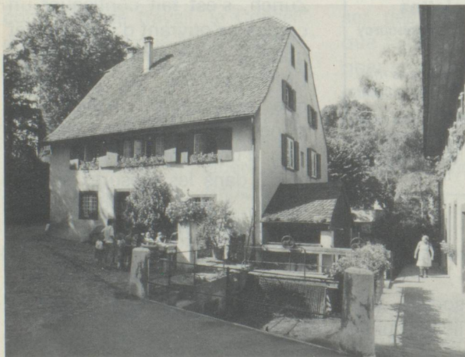
« Gruen 80 » à Bâle.

2 e Exposition suisse d'horticulture et de paysagisme. Parmi les nombreux bâtiments d'intérêt historique se trouve ce moulin bâti au XVI e siècle qui abrite un musée de la meunerie.