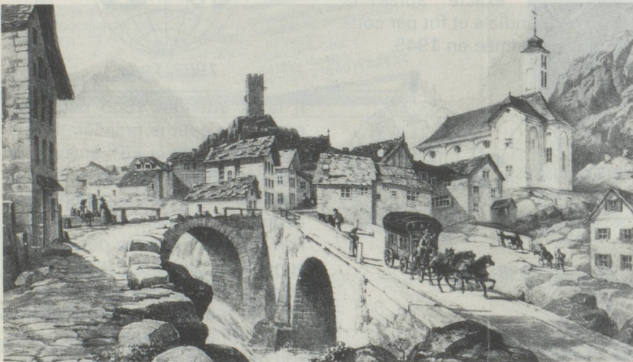
La diligence du St-Gothard passant en 1843 le village d'Hospental

« Saint-Gothard - VIA HELVETICA » par Arthur Wyss, conservateur du Musée des PTT à Berne. Traduit par Amédée Torche, Fribourg (avec préface du conseiller fédéral Willy Ritschard). Cet ouvrage richement illustré et rédigé de façon captivante est une vaste fresque des faits qui ont contribué de manière décisive à l'histoire du Gothard, fresque qui met en relief les impulsions d'ordre politique que ce col a engendrées et qui ont profondément marqué le devenir de la Confédération suisse. Il est en même temps une profession de foi pour ce passage le plus central des Alpes. Ses quelque 300 illustrations - dont plus de 50 en couleurs - tirées d'images, de documents, d'anciens cachets et oblitéra-