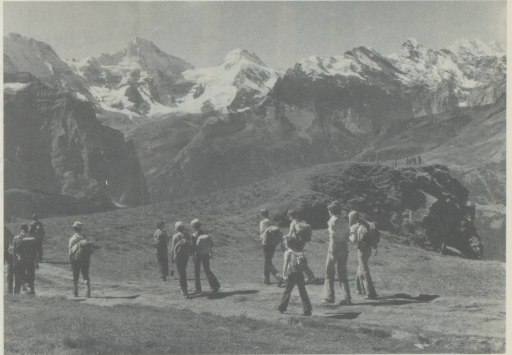
La joie des courses de montagne : ici le Männlichen un haut plateau dans l'Oberland bernois, accessible par téléphérique depuis Wengen et Grindelwald, sur la route panoramique vers la Petite Scheidegg.