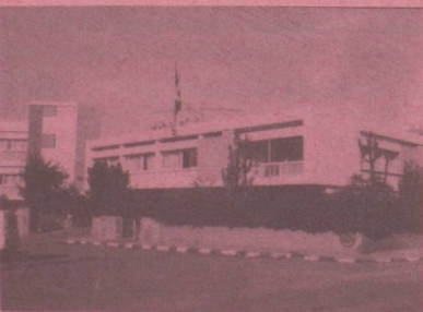
Rabat Ambassade de Suisse Boîte Postale 169 Square Condo-de- Satriano.