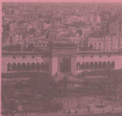
79, Mahaj Al-Hassan At-Tani (Avenue Hassan 111) Téléphone 26.02.11-26.02.12 Boîte postale 5