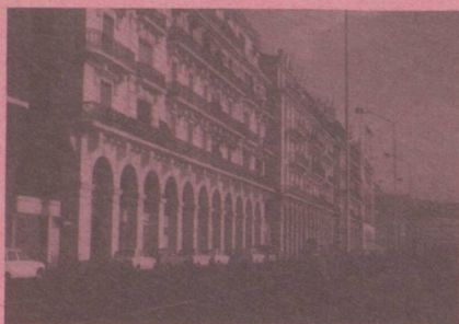
Ambassade, 27, bd Zirout Youcef, de 9 h à 12 h du dimanche au jeudi, Boîte postale 482, Alger-Gare, Algérie.