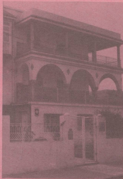
Ambassade de Suisse 1002 — TUNIS Belvédère Mutuelleville 10, rue Ech-Chenkiti Tél. : 281.917 — 280.132 Télex 12447