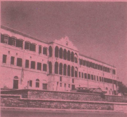
Beyrouth Ambassade, rue John-Kennedy Immeuble Achou, case postale 172, Beyrouth, de 9 h à 12 h, du lundi au vendredi Tél. 366.390/1