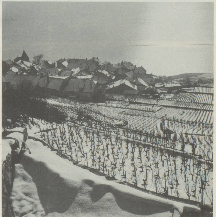
La Suisse romande.

Changement d'adresse : ne pas oublier d'indiquer votre ancienne adresse, notre fichier étant organisé par code postal.