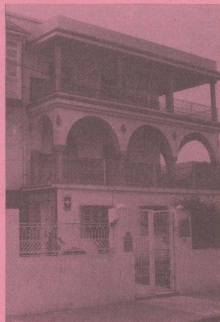
Ambassade de Suisse 1002 — TUNIS Belvédère Mutuelleville 10, rue Ech-Chenkiti Tél. : 281.917 — 280.132 Télex 12447