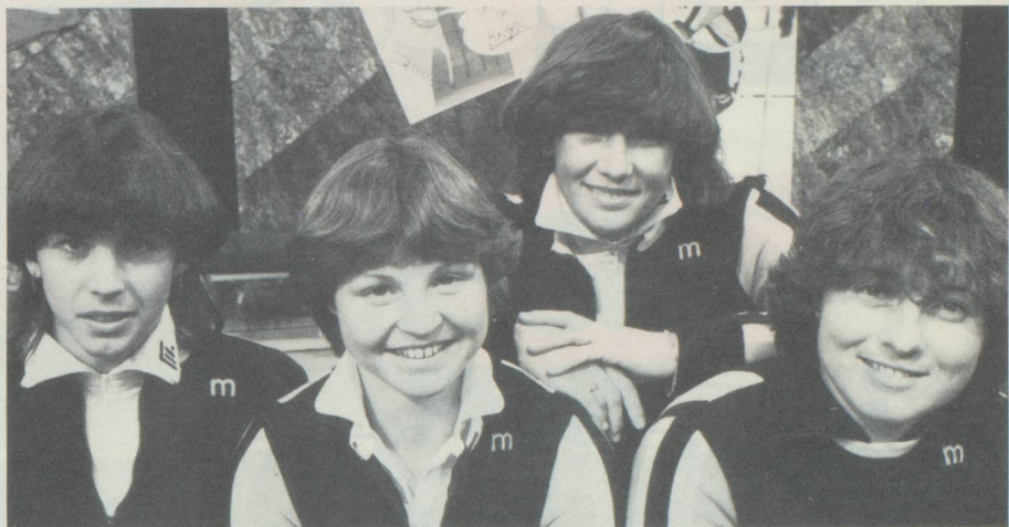
De g. à d. Doris de Agostini, Erika Hess, Maria Walliser et Marie-Thérèse Nadig.

Cette mignonne jeune fille de Mosnang dans le Toggenbourg qui vient de fêter ses 18 ans le 27 mai a disputé sa première saison entière en coupe du monde. Son succès a été éclatant. Elle a conquis ses premiers points dans la première compétition du Val d'Isère et à la fin de la saison cette spécialiste des courses à portes avait récolté des points dans toutes les disciplines et était la nouvelle venue de la saison la plus couronnée de succès. Pétillante d'ambition et de plaisir à skier, Maria Walliser qui aime passionnément les chevaux et vient, malgré les fatigues de la compétition mondiale, de terminer son apprentissage de commerce avec la mention bien, nous expliquait: «Ce n'est que maintenant que j'ai vraiment