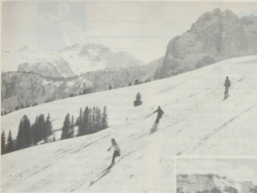
Rougemont dans les Alpes vaudoises. Depuis la région de ski bien connue de la Videmanette, il y a 6 pistes, au total 50 km pour descendre dans la vallée.