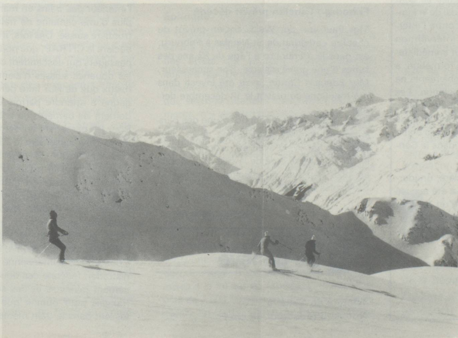
Andermatt en Suisse centrale. Sur la piste de Gemstock, les skieurs glissent jusqu'à la station de vacances, située 1500 m plus bas.