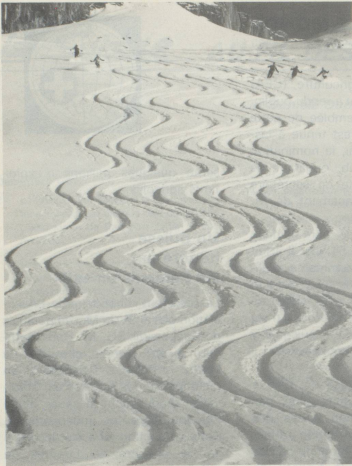
Décorations éphémères sur la neige. Souvenirs inoubliables de vacances passées en Suisse