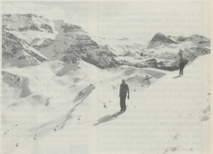
Adelboden dans l'Oberland bernois. Une des plus belles régions de ski au-dessus de la station est le Laveygrat à 2200 m.